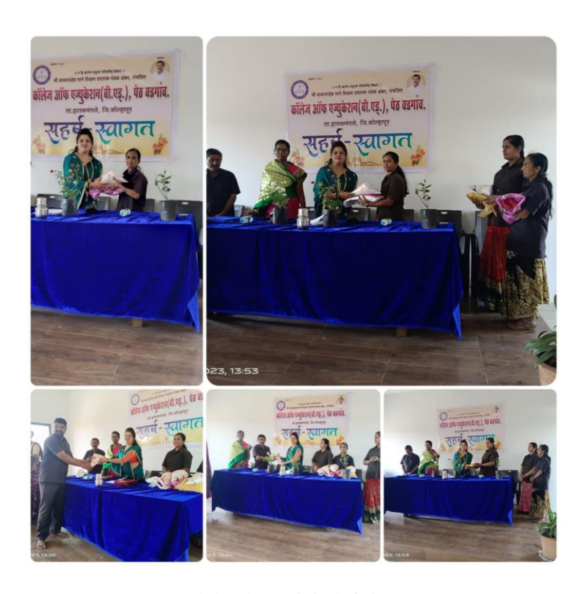
Felicitation of Chief Guest