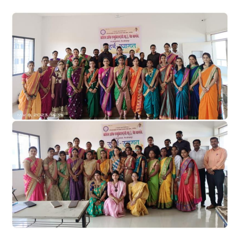
B.Ed. First year and Second year Batch