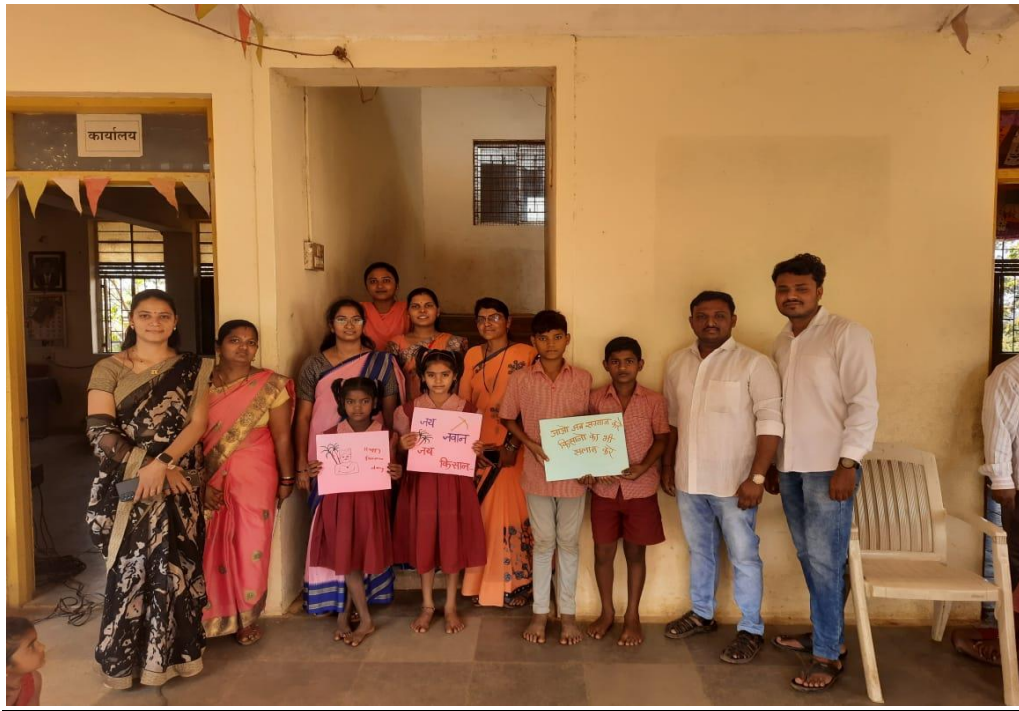
Farmer Day celebration at Internship