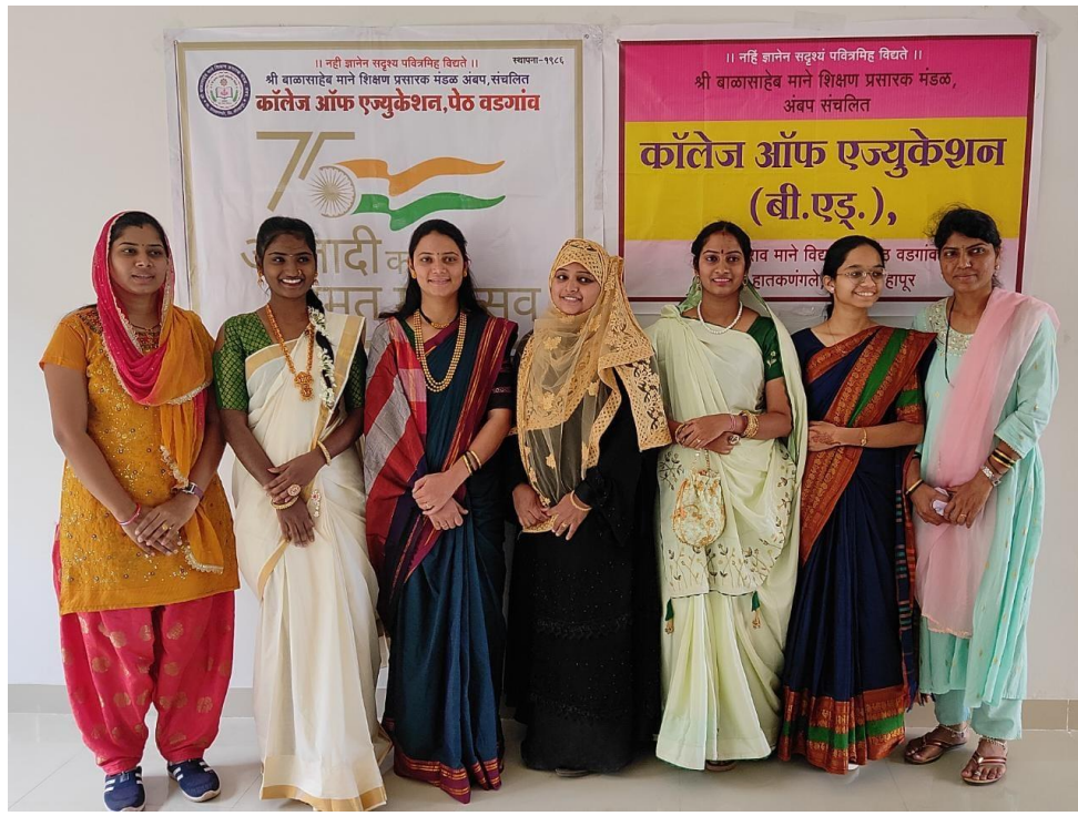
Traditional day celebration