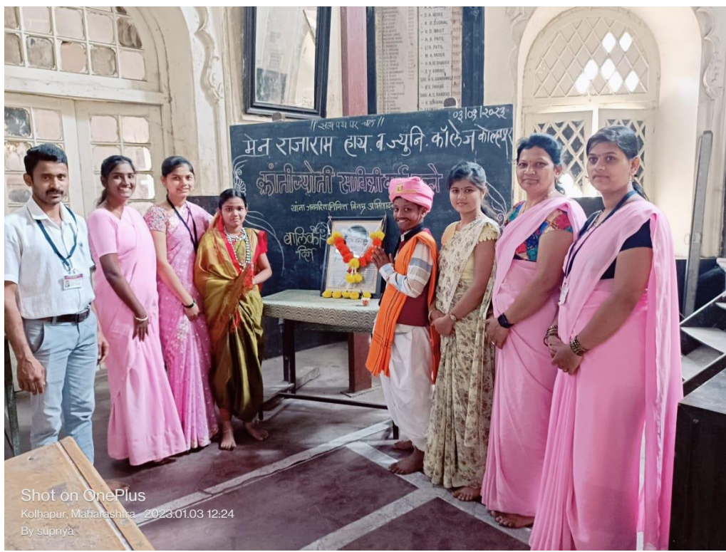
Celebration of Savitribai Phule Jayanti