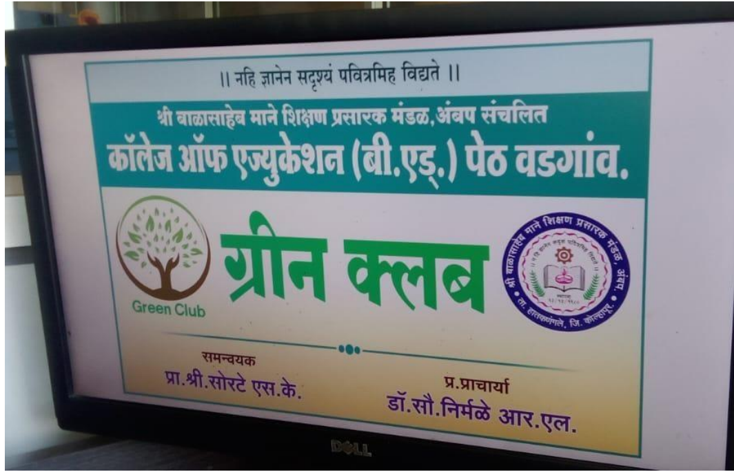
Certificate of one day workshop of Green club